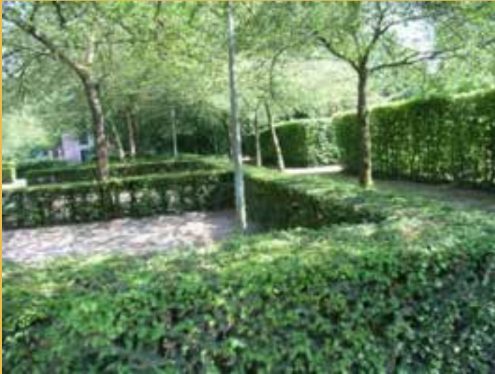
Wintergroen 80 en 120 cm hoog