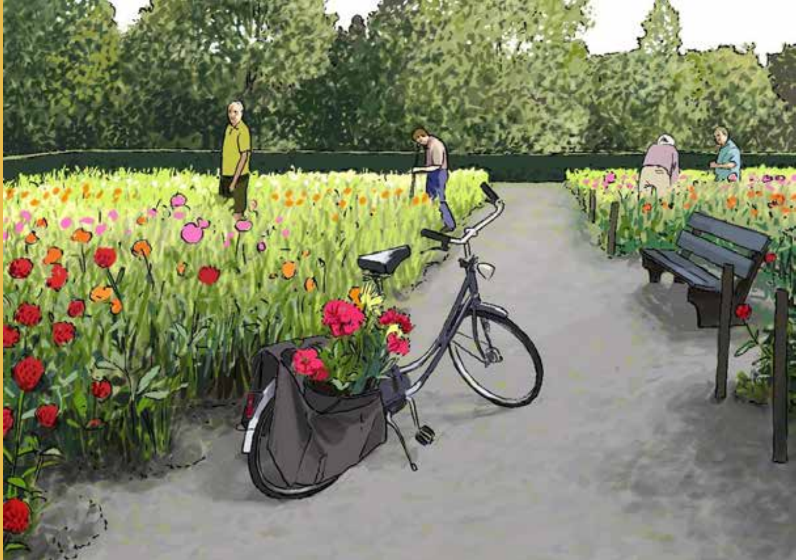
Metgensbleek als Dahliatuin