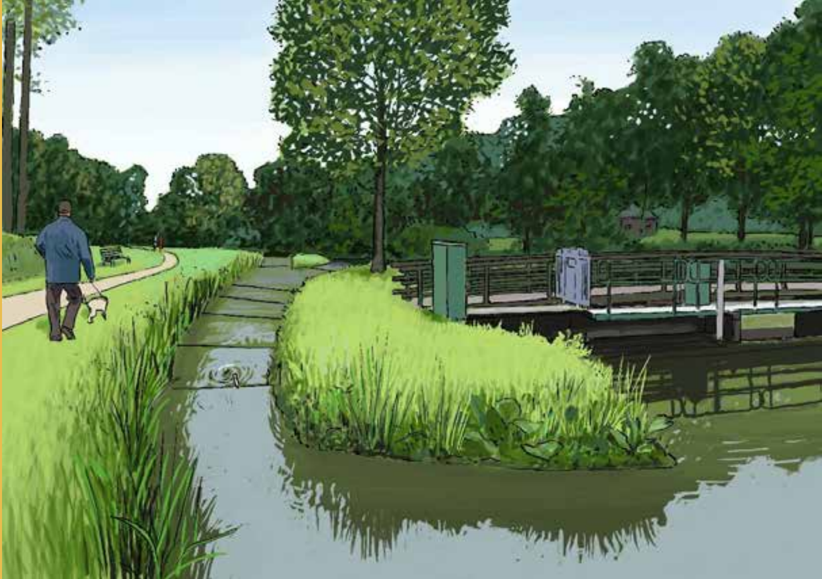
Een vistrap in de Heiligenbergerbeek