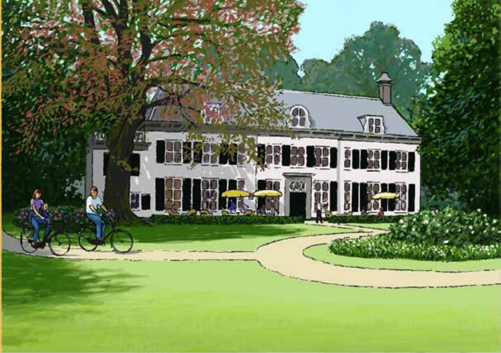
Huize Randenbroek met horeca