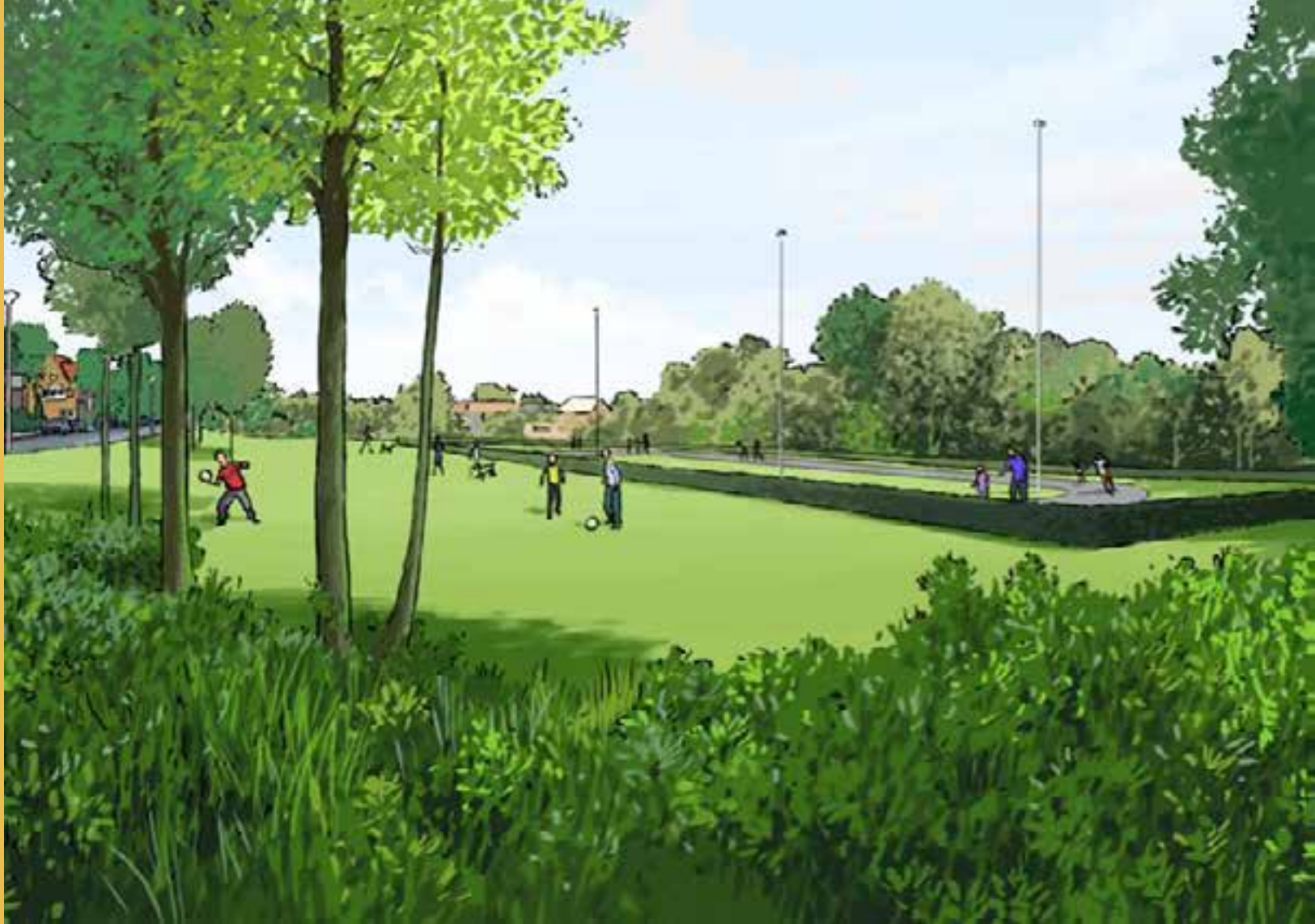
Ijsbaanterrein met skeelerbaan