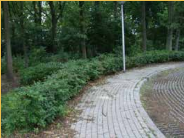
Bladverliezend 120 en 180 cm hoog