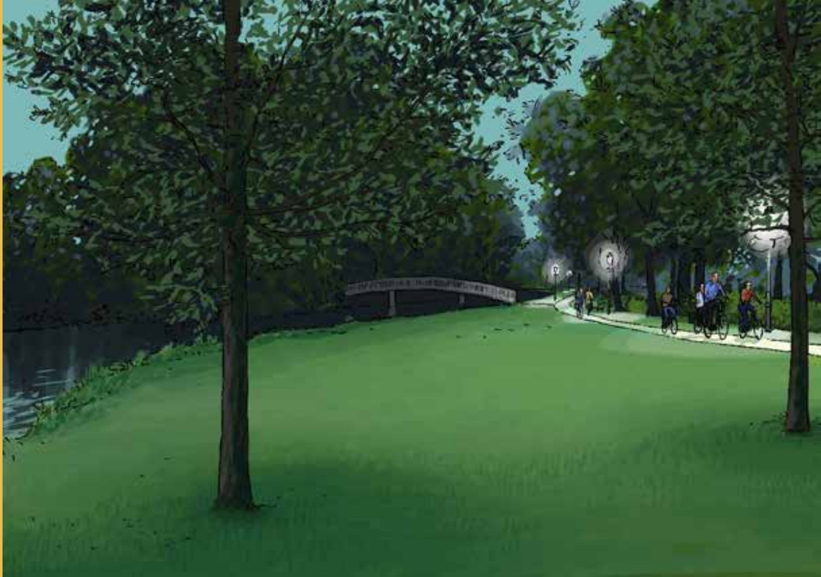
Fietspad langs de beek met verlichting